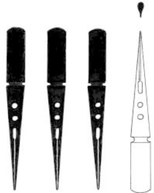
Logo H.J. Uthke

... GEGEN DEN STROM 4. bis 7. November 2004