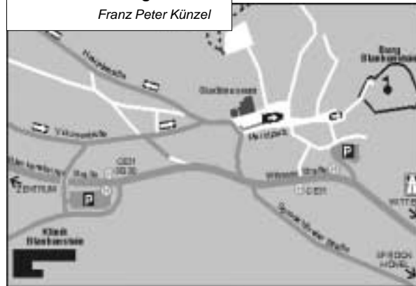
A 43, Ausfahrt Witten-Herbede, Richtung Blankenstein