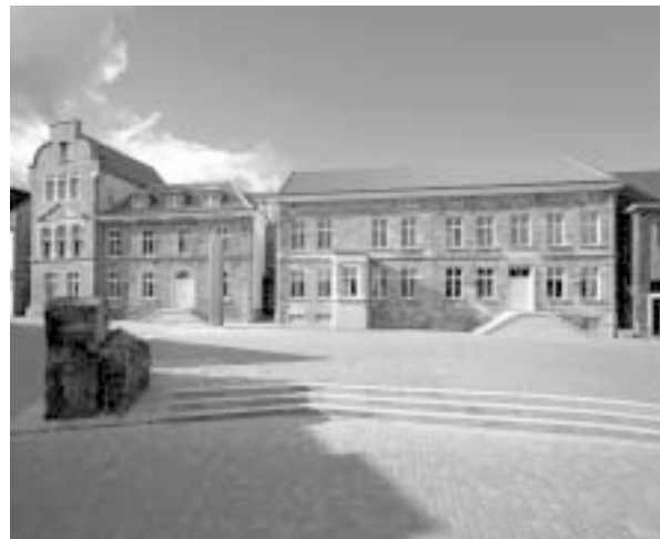
Stadtmuseum Hattingen in Blankenstein

“Aphorismen führen den Leser nur ein Stück in besondere Richtung; die Weite des Weges muß er selbst zurücklegen.”